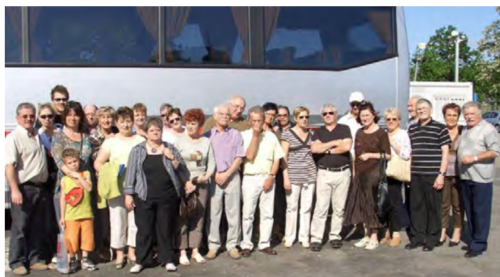
Sortie du 1 er Juin au musée de l'automobile de Mulhouse.

Participez à la marche illuminée, à travers le village ! Rendez-vous le 21 décembre à 19h place de la fontaine.