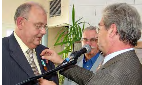
30 ans de service récompensés

16 mars) à l'occasion desquelles vous aurez la possibilité de renouveler votre confiance à une équipe municipale partiellement renouvelée que je conduirai pour la sixième fois et à votre