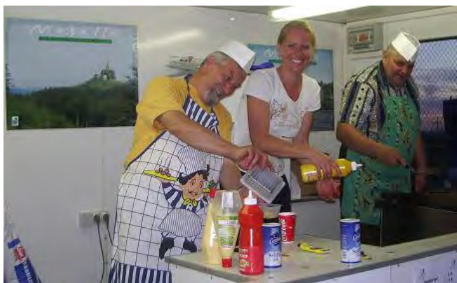
La bonne humeur communiquée à tout le village...

Le comité directeur de l'Association des Loisirs vous présente ses meilleurs vœux pour 2008 et vous confirme son programme de festivités : feux de la Saint Jean, feux d'artifice du 14 juillet et fête patronale.