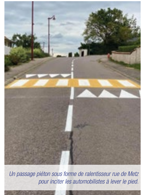
Un passage piéton sous forme de ralentisseur rue de Metz pour inciter les automobilistes à lever le pied.

A propos de la sécurité routière, la commune invite à la prudence via un panneau de signalisation à l'entrée du village ainsi que plusieurs cinémomètres préventifs . Leurs installations n'entrent pas dans