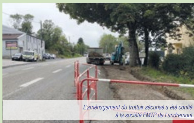
L'aménagement du trottoir sécurisé a été confié à la société EMTP de Landremont