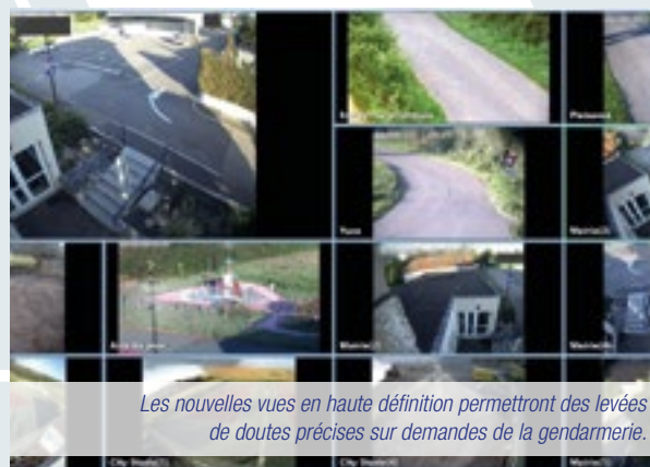
Les nouvelles vues en haute définition permettront des levées de doutes précises sur demandes de la gendarmerie.