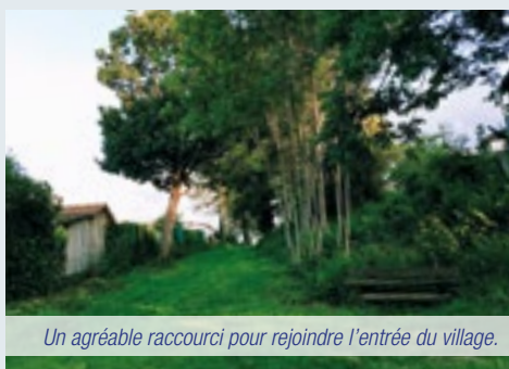
Un agréable raccourci pour rejoindre l'entrée du village.

Nombreux sont les concitoyens qui ont remarqué les travaux d'élagage et d'entretien réalisés sur le chemin situé entre la rue de Metz et la rue du Grand Breuil . Une excellente idée pour ceux qui souhaitent s'y promener et profiter de la quiétude de cette belle allée.