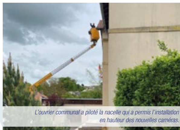
L'ouvrier communal a piloté la nacelle qui a permis l'installation en hauteur des nouvelles caméras.

Les caméras installées en 2017 à l'entrée du village ont permis aux équipes de gendarmerie de résoudre plusieurs affaires de cambriolages et de confondre les délinquants. La municipalité réélue avait pour ambition de compléter le dispositif en ajoutant une caméra pour visualiser la circulation du chemin vers Les Etangs et surveiller les principaux espaces publics : aires de jeux, city stade, nouvel entrepôt communal, accès au foyer sillois et à l'école... C'est chose faite depuis le début de l'été !