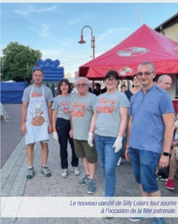
Le nouveau comité de Silly Loisirs tout sourire à l'occasion de la fête patronale.

La pandémie mondiale aura mis à mal la vie associative dans le pays. Mais à Silly-sur-Nied, même si on a tendu le dos durant 18 mois, les activités redémarrent progressivement .