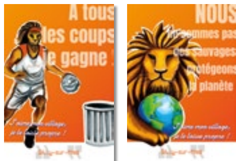
Le lion, emblème de Silly-sur-Nied, montre la voie à suivre.