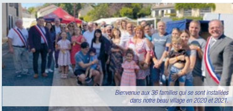
Bienvenue aux 36 familles qui se sont installées dans notre beau village en 2020 et 2021.

Le 2ème dimanche de septembre, les habitants du village prennent plaisir à se retrouver lors de la fête patronale. Ils prennent des nouvelles des uns et des autres, se racontent leurs vacances autour d'une bière et d'une barquette de frites. Les enfants jouent au chamboule-tout, les anciens aux quilles. Que c'est bon de se retrouver ! C'est aussi l'occasion pour les nouveaux habitants de s'imprégner des us et coutumes des Sillois et de commencer à tisser quelques liens. La municipalité les accueille chaleureusement en partageant le verre de l'amitié.