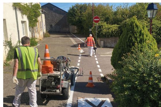
Marquage au sol pour sécuriser les cheminements autour du Foyer sillois et du groupe scolaire « L'île aux oiseaux »