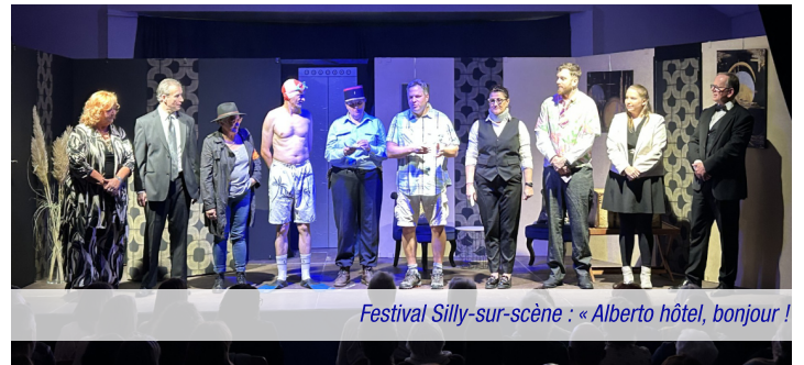
Festival Silly-sur-scène : « Alberto hôtel, bonjour ! »

Le village sait aussi se transformer en scène culturelle et sportive grâce à des acteurs passionnés. Au printemps, la troupe de théâtre Silly Con CarNied monte sur les planches du festival « Silly-sur-Scène » ancrant l'art et l'humour au cœur de notre village. En juin, le Tennis Club de Silly prend le relais en mêlant compétition et convivialité lors de ses portes ouvertes et sa fête annuelle.