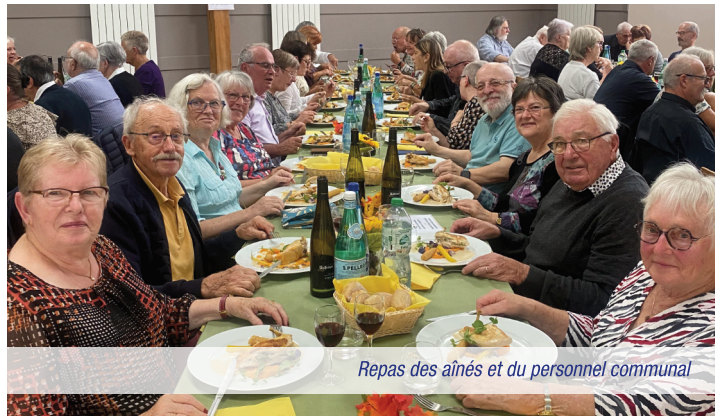
Repas des aînés et du personnel communal

Cet engagement institutionnel se décline tout au long de l'année avec des rendez-vous intergénérationnels essentiels : le repas des aînés en octobre, qui honore nos doyens dans une ambiance festive, et la tournée de St Nicolas en décembre, qui vient clore l'année en faisant briller les yeux des plus petits.