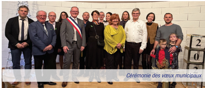
Cérémonie des vœux municipaux

Dès les premiers jours de janvier, la Municipalité lance les festivités avec les traditionnels vœux. Ce moment privilégié permet de rassembler les citoyens autour des projets communs et de renforcer l'unité du village.