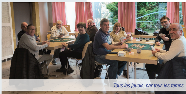
Tous les jeudis, par tous les temps