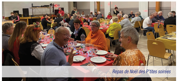
Repas de Noël des P'tites soirées

L'association Les P'tites Soirées apporte une touche de convivialité précieuse lors des périodes plus fraîches : on lui doit, entre autres, les dégustations du Beaujolais Nouveau en novembre et le chaleureux Repas de Noël en décembre. Ces rendez-vous de tous les quinze jours, sont la preuve que la solidarité et la bonne humeur sont les meilleurs remparts contre la grisaille hivernale.