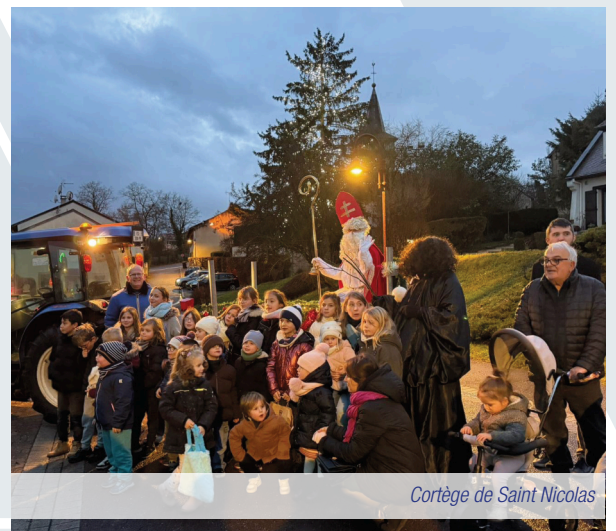
Cortège de Saint Nicolas