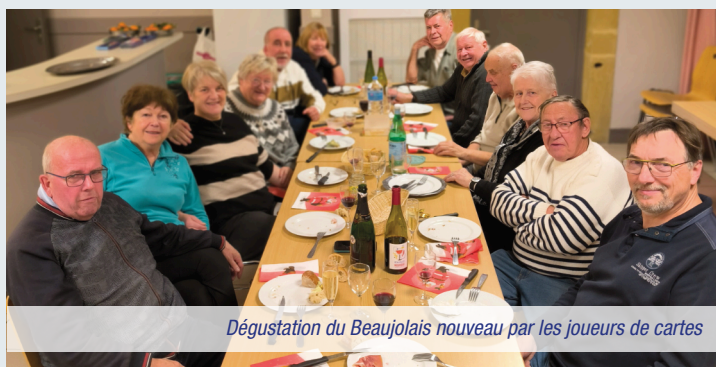
Dégustation du Beaujolais nouveau par les joueurs de cartes

Un bel exemple de dynamisme associatif local , porté par l'engagement et la fidélité de ses participants.