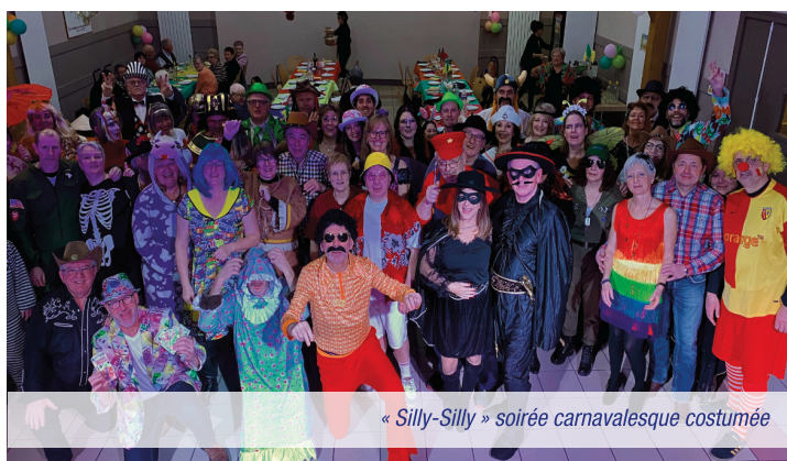
« Silly-Silly » soirée carnavalesque costumée